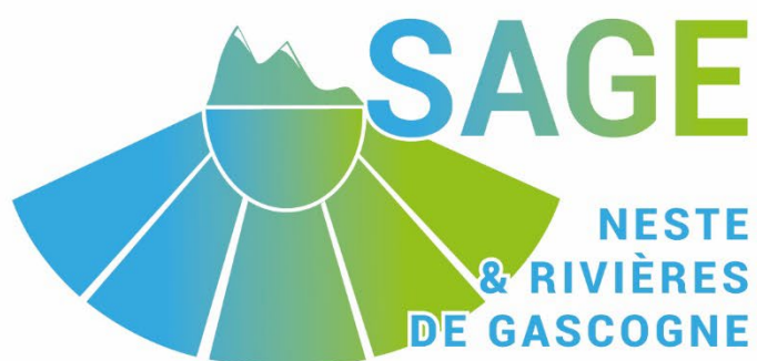
Schéma d'Aménagement et de Gestion des Eaux